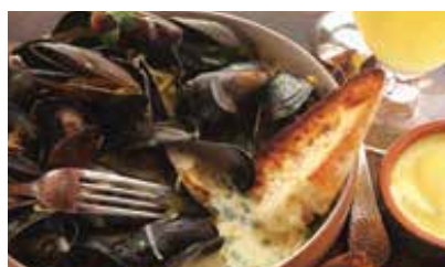
3道菜-布鲁塞尔 - 青口贝

免责声明: 由于新冠肺炎疫情旅行限制, 当地/宗教节日, 公众假期, 天气状况, 交通等情况, 自然灾害, 必要时黄金旅程保留对行程进行适当调整 (调整景点游览顺序) 以确保行程顺利进行, 会或事先通知。