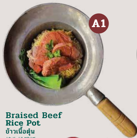
A1 Braised Beef Rice Pot ข้าวเนื้อตุ๋น 炖牛排锅饭