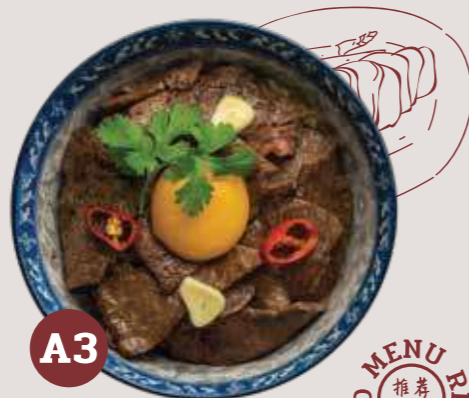
A3 Sam Yot Station (Exit3) Beef Bowl

Pan seared beef in Yih Sahn Luhk sauce on Garlic Rice with cured yolk ข้าวหน้าเนื้อสามยอด (ทางออก3) ข้าวหน้าเนื้อสไลด์สะตู่ไฟ ไข่แดงขอส่น้ำปลา 三杨地铁站(出口三)盖饭:香煎牛肉片、生咸蛋、鱼露酱和香蒜炒饭