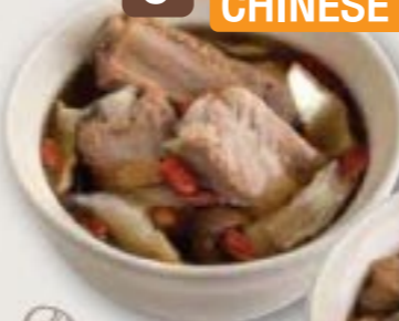
9 BLACK CHICKEN WITH CHINESE HERBS SOUP