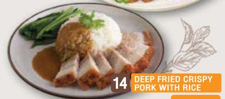
14 DEEP FRIED CRISPY PORK WITH RICE