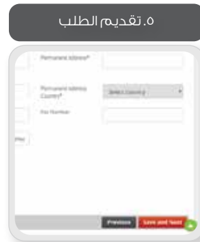
٥. تقديم الطلب