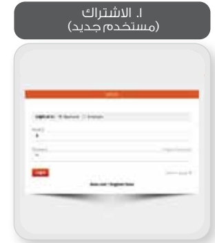
١. الاشتراك (مستخدم جديد)