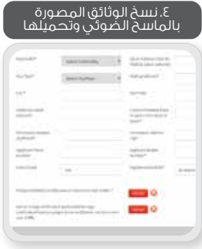
٤. نسخ الوثائق المصورة بالماسح الضوئي وتحميلها

للدليل المفصل لكيفية تقديم الطلب، قم بزيارة www.dataflowgroup.com/QCHPHTA