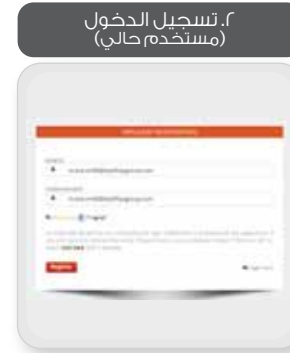
٢. تسجيل الدخول (مستخدم حالي)