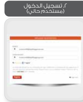
٢. تسجيل الدخول (مستخدم حالي)