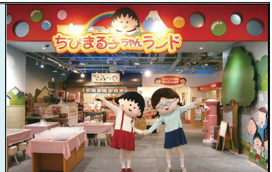
清水夢幻廣場(櫻桃小丸子樂園)