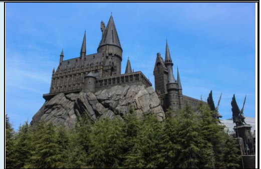
哈利波特魔法世界™霍格華茲™城堡