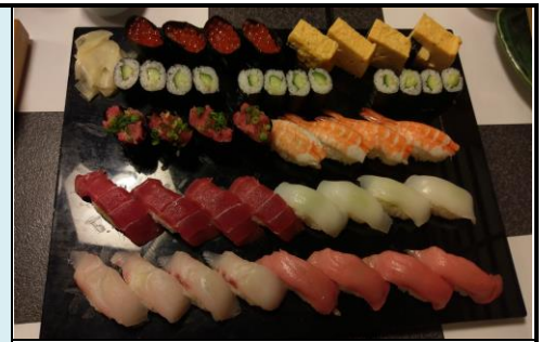
晚餐於喜代村餐廳