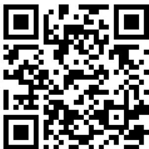
(比賽系統 QR code)