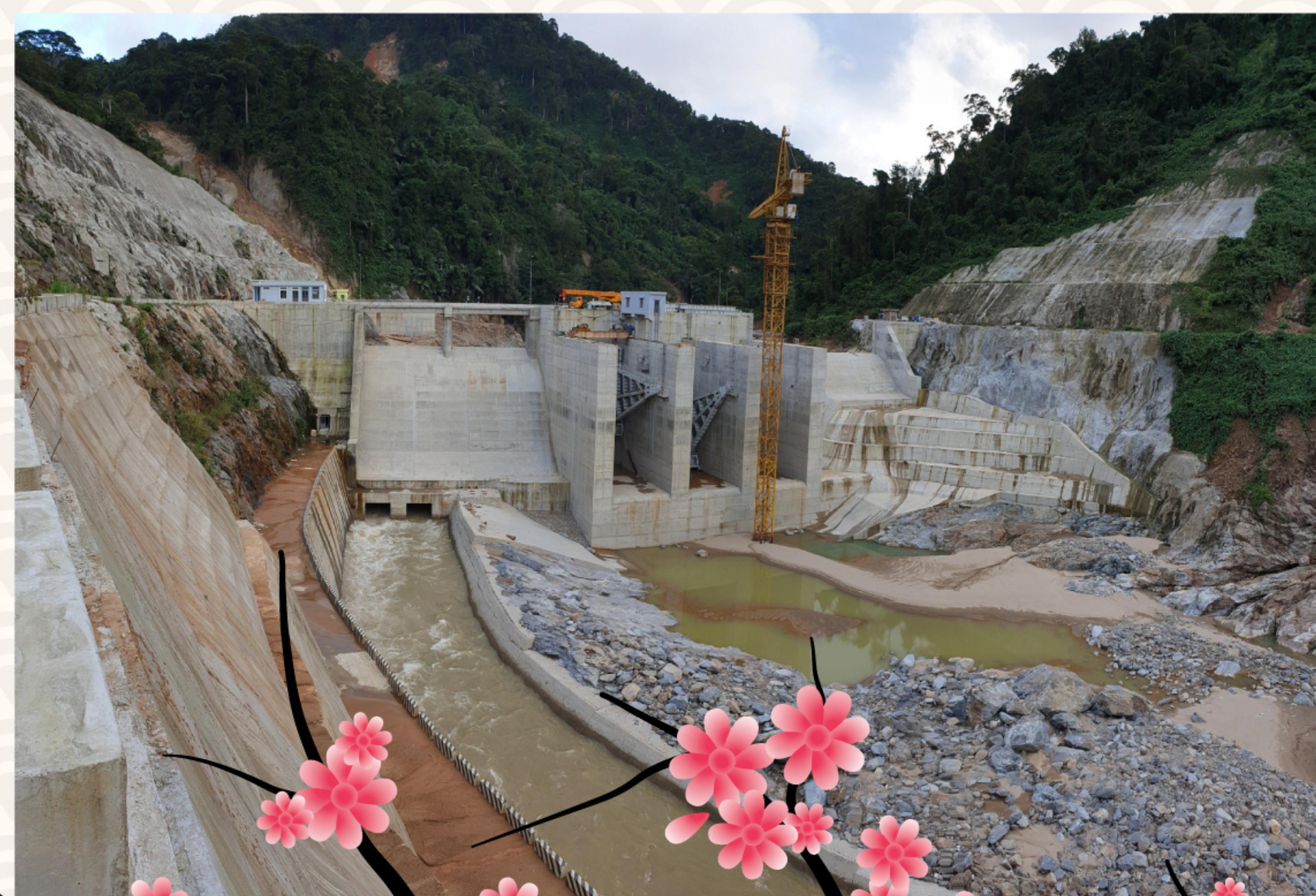
Nhà máy Thủy điện Đăkmi 2

Dự án thủy điện Đăk mi 2 hiện đã hoàn thiện công tác khắc phục đường giao thông và ảnh hưởng công trình sau bão lũ. Ban quản lý dự án đang đẩy mạnh thi công dự án, hoàn thiện nốt 140m/7,2km đường hầm dẫn nước, đảm bảo tiến độ phát điện vào tháng 5/2021.