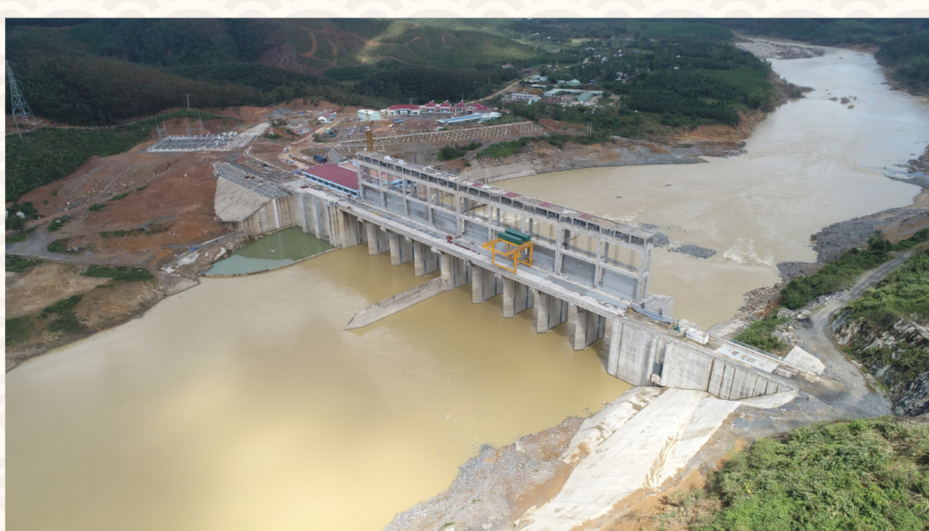
Nhà máy Thủy điện Sông Tranh 4

Dự án thủy điện Sông Tranh 4 cơ bản đã hoàn thiện công tác thi công nhà máy, dự kiến phát điện trong Quý I/2021.