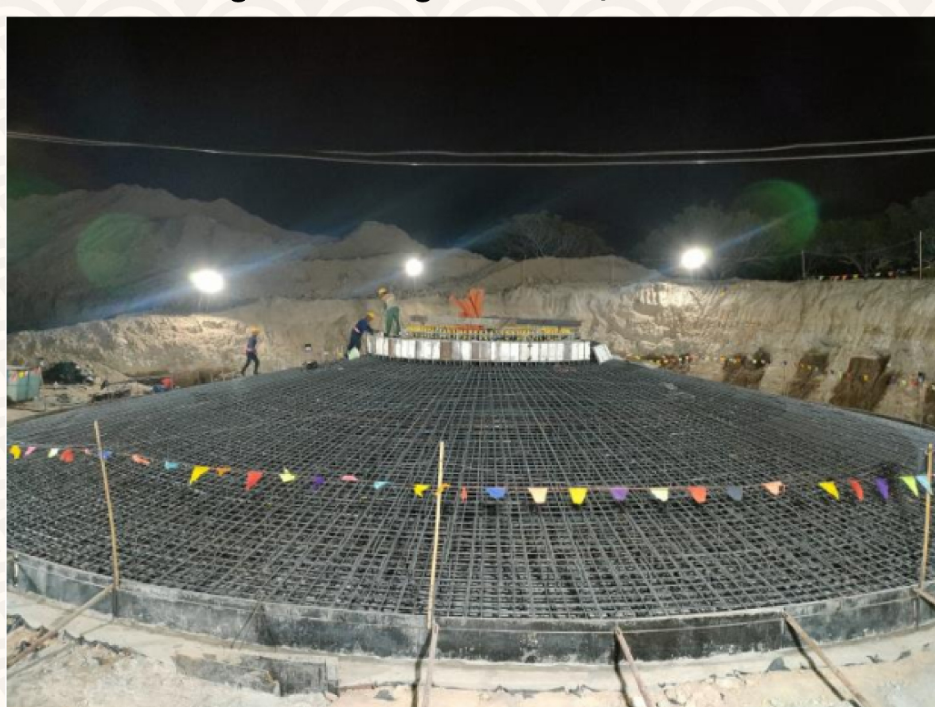
Lắp dựng cốt thép móng N10 dự án 7A

Dự án điện gió 7A đã đào đủ hố móng cho 12 tuabin và hoàn thiện thi công 9/12 móng. Hiện các thiết bị, tuabin đang được nhà thầu Enercon vận chuyển về Việt Nam, dự kiến sẽ đến cảng trước dịp Tết nguyên đán. Dự án đang được cấp tập triển khai để đảm bảo tiến độ phát điện tuabin đầu tiên trong tháng 5/2021.