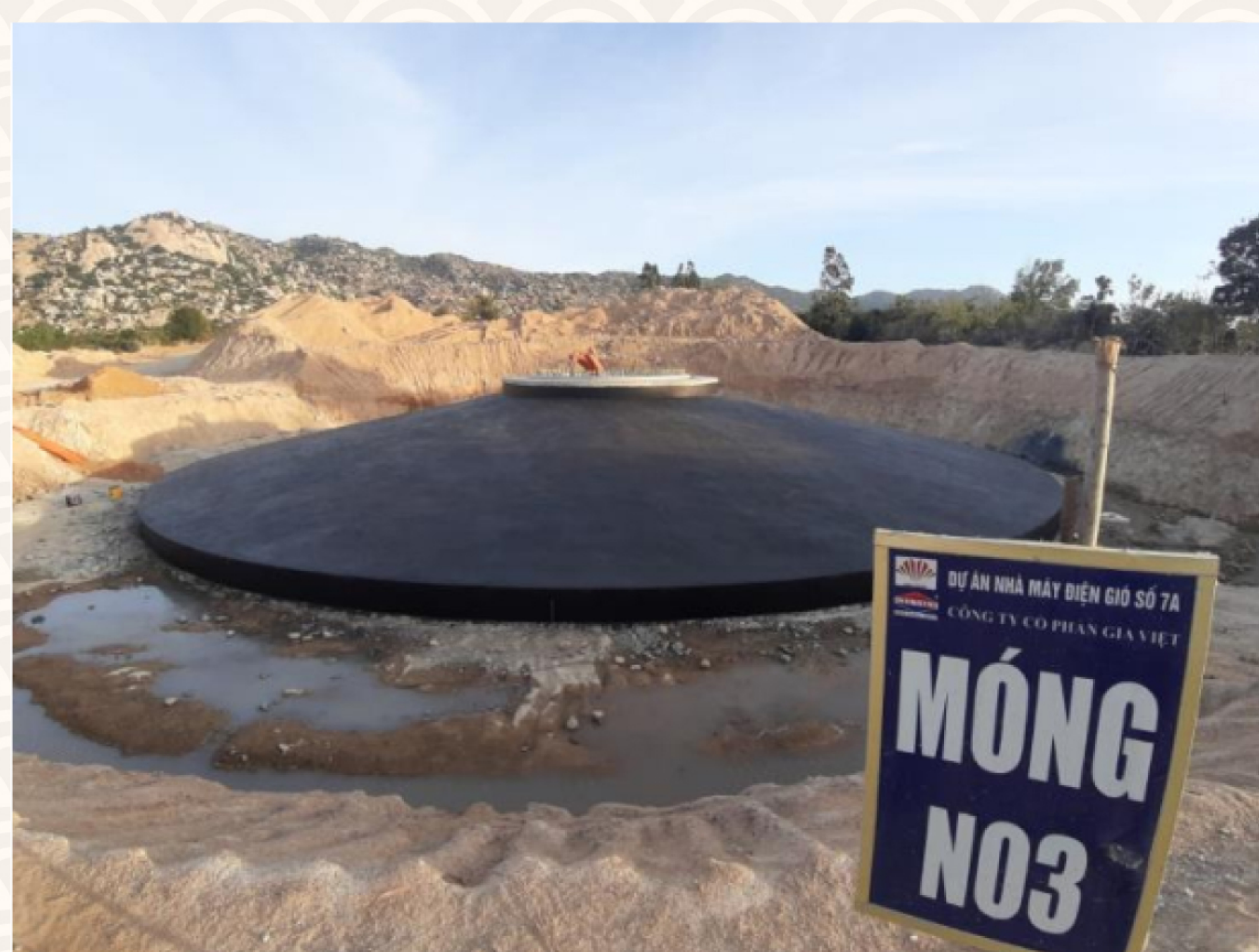
Thi công quét chống thấm lót móng N03 dự án 7A

Dự án thủy điện Đăk mi 2 hiện đã hoàn thiện công tác khắc phục đường giao thông và ảnh hưởng công trình sau bão lũ. Ban quản lý dự án đang đẩy mạnh thi công dự án, hoàn thiện nốt 140m/7,2km đường hầm dẫn nước, đảm bảo tiến độ phát điện vào tháng 5/2021.